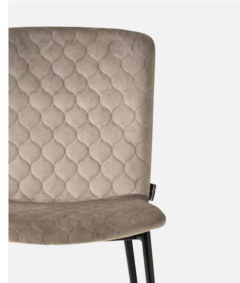
Love Sedia / Chair CS21885-A P15 / S0F