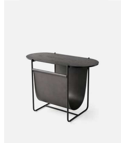
Magazine Tavolino / Coffee table CS5108 P15 / P15L-315